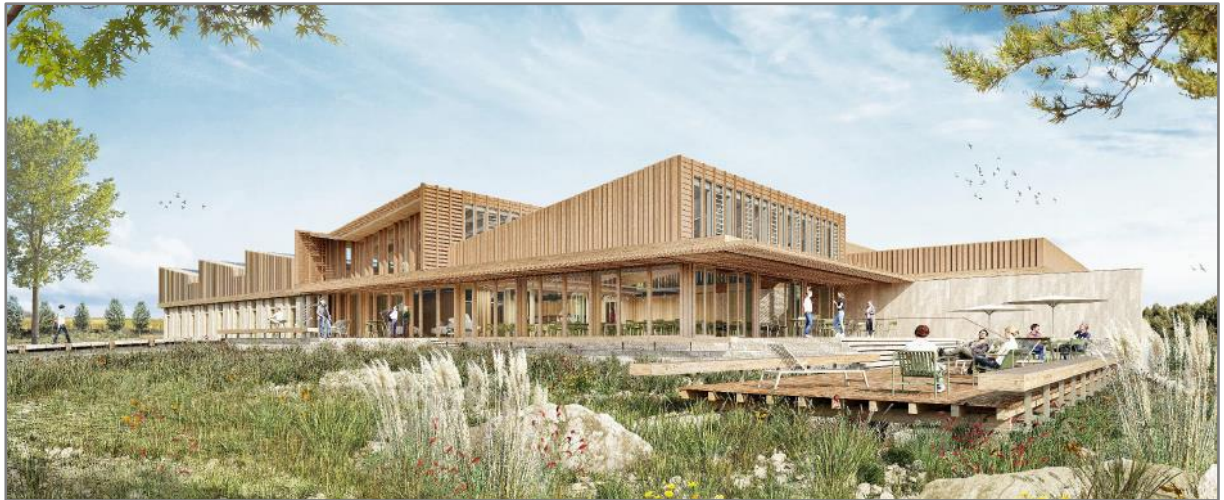
SARL D'ARCHITECTURE GUIRAUD - MANENC